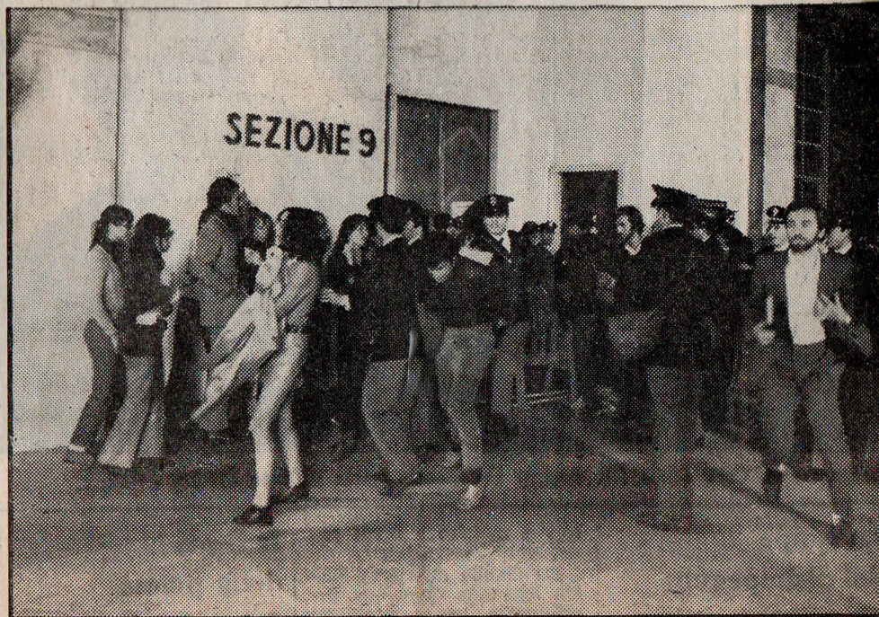
Una immagine dei disordini verificatisi fuori dell'aula del tribunale.